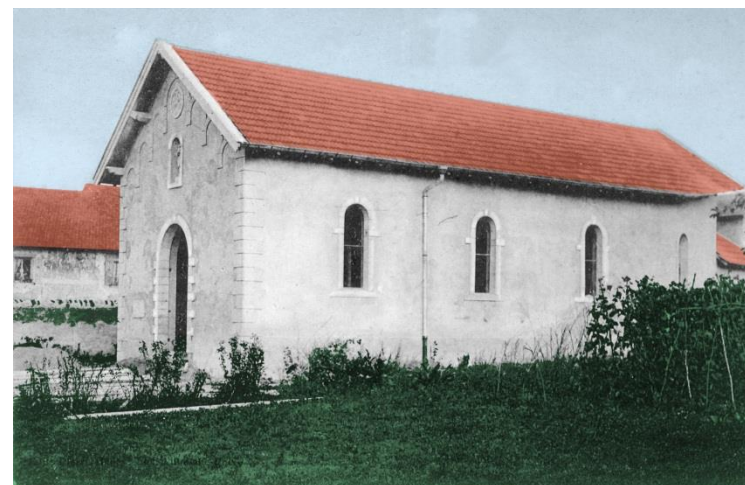
La chapelle de 1922